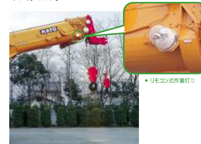
●リモコン式作業灯 □

ブームの先端部に指向性に優れた、明るい大型の作業灯を採用。夜間作業も安心です。また、操作はキャブから簡単に行えます。 □