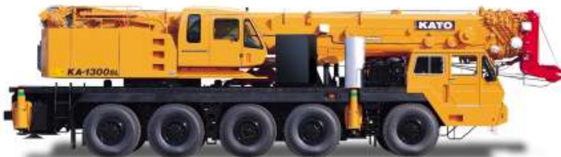
• 右側面(オプション仕様) □