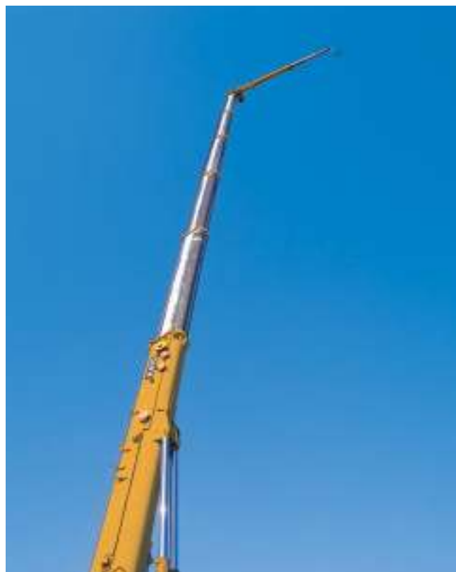
・高剛性丸型断面ブーム □