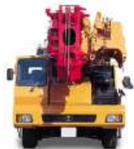
• フロント □