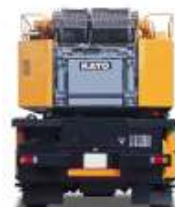
• リヤ □