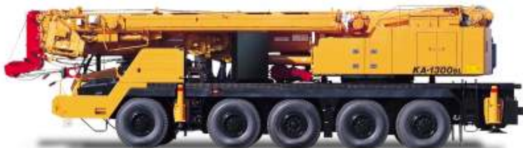
• 左側面(オプション仕様) □